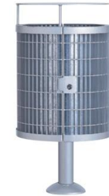
bornes de propreté

sur potelet sans couvercle à sceller FCR